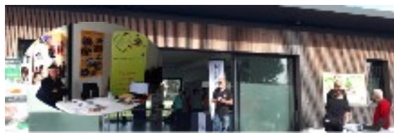
Forum du handicap : Nous étions présents le 25 mars 2023 lors du Forum de la semaine hendayaise du handicap organisée par la Ville de Hendaye