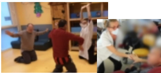
Photo haut de page : Voix-Chant : Les leçons pour apprendre à respirer, à former des sons dans le rythme, dans le ton, à l'unisson : ces moments ouvrent le souffle et libèrent la voix, font jaillir des capacités enfouies.

Danse inclusive : l'expression corporelle, c'est parler avec son corps, le déplier, étirer ce qui est recroquevillé, toucher avec des caresses ou détendre des contractions qui semblaient définitivement bloquées, quelle joie de bouger, de rechercher l'harmonie dans les gestes et avec la musique, de se dépenser enfin avec les autres danseurs.