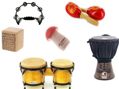
petits Tam-Tam ou Tambours

...écouter le rythme, le reproduire tout seul puis ensemble, puis à tour de rôle, puis en accompagnement d'une mélodie. ...Apprendre la vitesse d'exécution, l'intensité : tout doucement, avec deux doigts, puis avec trois, puis avec les deux mains, on ralentit, on accélère.